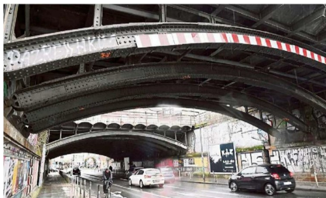
Die Deutsche Bahn will die Brücke an der Venloer Straße am Bahnhof West durch einen Neubau ersetzen, obwohl sie unter Denkmalschutz steht.