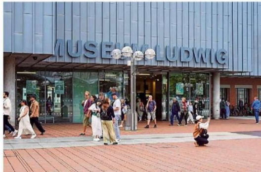
Das Museum Ludwig ist eines der zehn städtischen Museen, für am Kolntag alle Menschen mit Wohnsitz in Köln freien Eintritt haben.